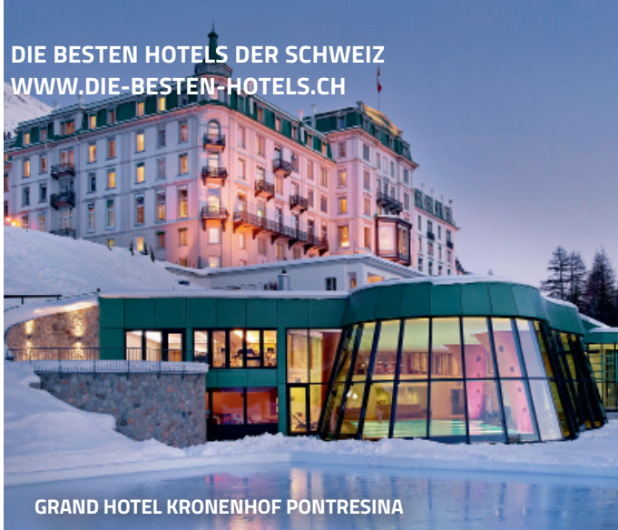
GRAND HOTEL KRONENHOF PONTRESINA

DIE BESTEN HOTELS DER SCHWEIZ WWW.DIE-BESTEN-HOTELS.CH