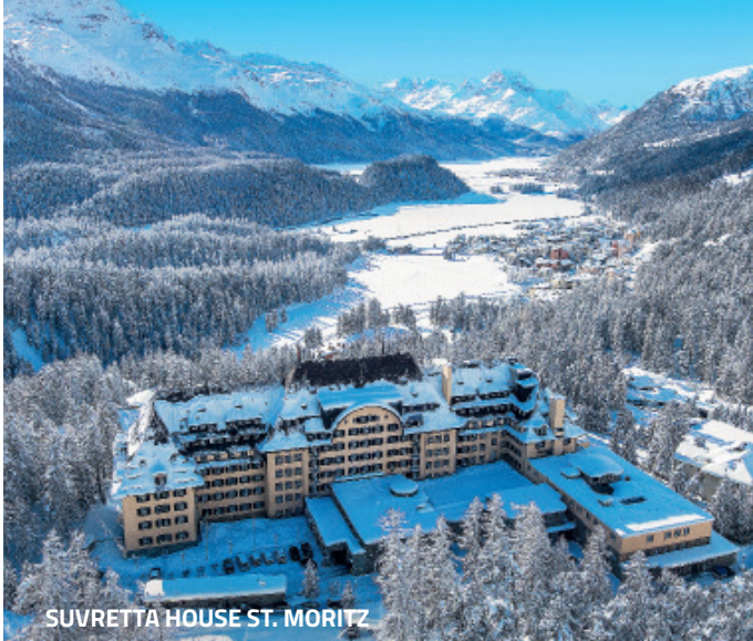
SUVRETTA HOUSE ST. MORITZ