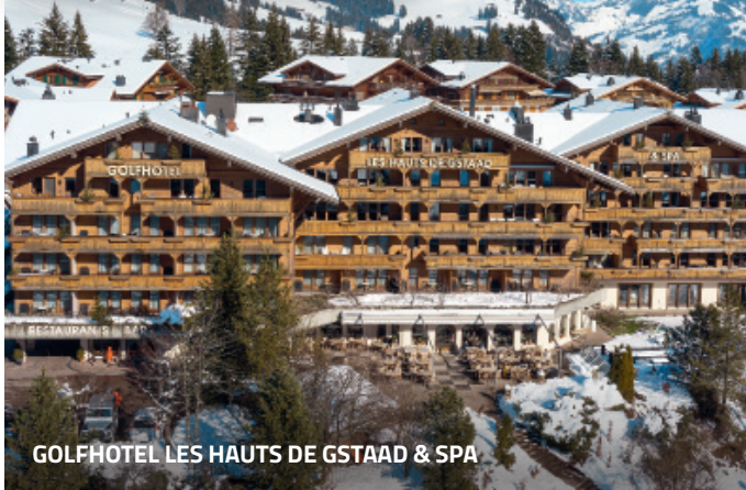
GOLFHOTEL LES HAUTS DE GSTAAD & SPA