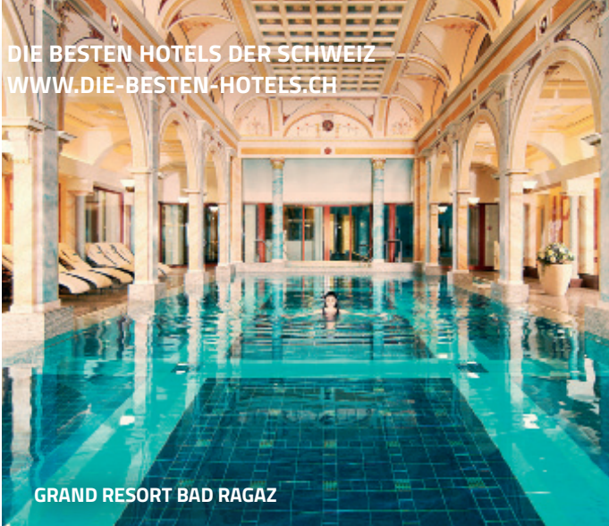
GRAND RESORT BAD RAGAZ