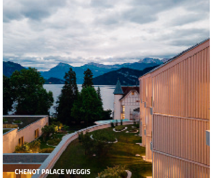
CHENOT PALACE WEGGIS

Beste Lage: Hotels, in denen der Einkehrschwung zum Erlebnis wird