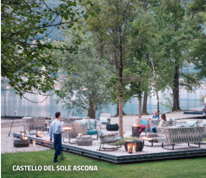
CASTELLO DEL SOLE ASCONA