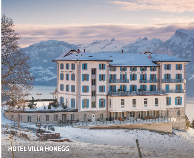
HOTEL VILLA HONEGG

Der persönliche Eindruck: Hier haben unsere Leser wunderbar geschlafen.