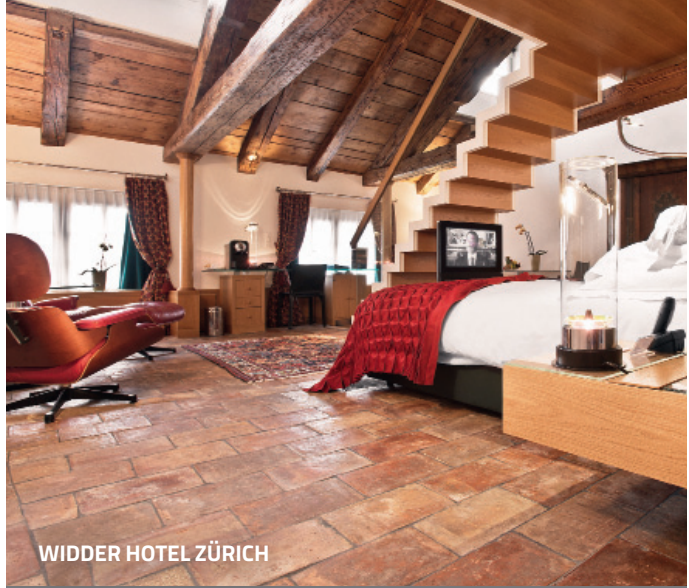
WIDDER HOTEL ZÜRICH

Entschleunigen, entspannen, auftanken: exquisite Energiequellen