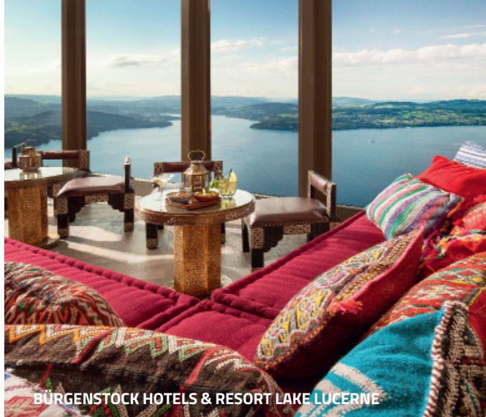
BÜRGENSTOCK HOTELS & RESORT LAKE LUCERNE

Edles Ambiente und bester Service für besondere Momente im Urlaub